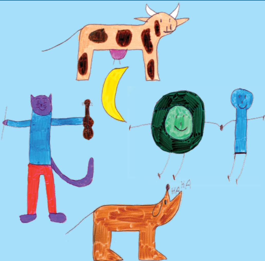
Ilustración: "Hey Diddle Diddle", de Eytan Nisinzweig, un artista con autismo.